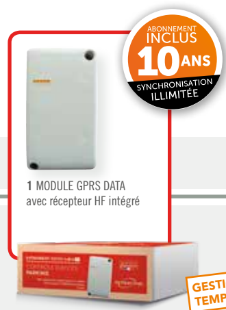
1 MODULE GPRS DATA avec récepteur HF intégré

06-0129 INTRABOX DATA MINI HF : 1 module de transmissions Eco avec récepteur HF intégré avec synchronisation des données Data illimitées 10 ans